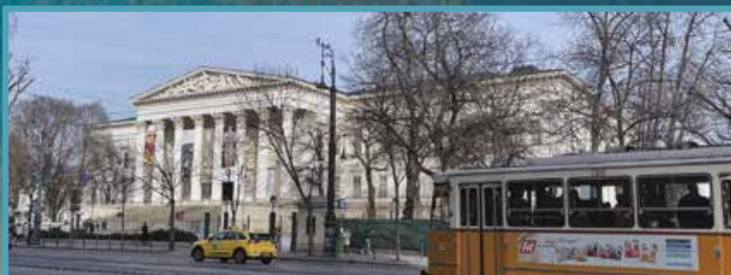
Nemzeti Múzeum és piactér